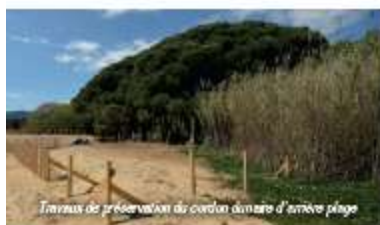
Travaux de préservation du cordon d'arrière plage

La zone de nature préservée correspond aux espaces de maquis, cordon littoral et ripisylve. La fréquentation n'y est pas encouragée et les interventions sont réduites.